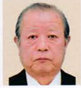
小山 込山 正秀 まごころの奉仕で 地域に根差す ライオンズ魂