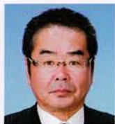
YCE委員 静岡橋 篠原 弘 気発せげババ力生ゼズ 意用ヒザレバ技ナラス