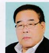
藤 枝 成島 実 地域に根差した 愛する奉仕