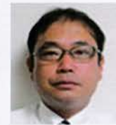
清水 新山 久 伝統を紡ぎ 新しい奉仕の輪を 広げよう