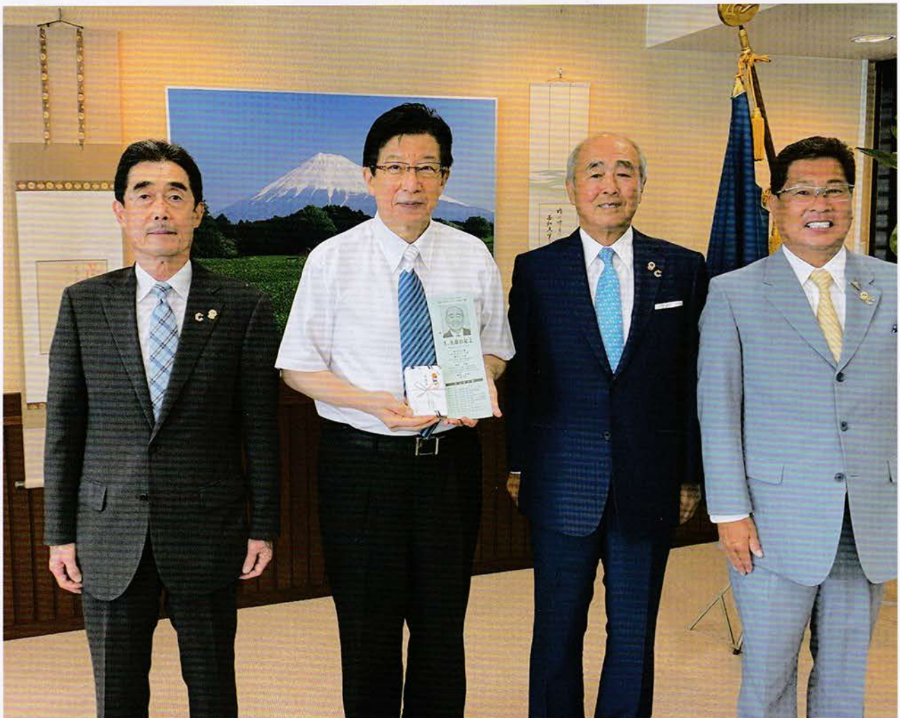
左から関キャビネット会計、川勝静岡県知事、久保田地区ガバナー、服部キャビネット幹事