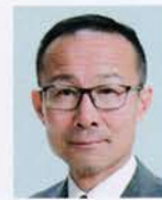
小笠 宮城也寸志 新しい生活様式を守り ながらも、朗らかに 笑ってできる活動を