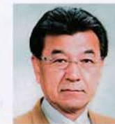
静岡橋 西野 誠 築かれた伝統と実績を 誇りに、未来へつなく 奉仕の和