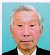
1Z 静岡橋 磯谷 巖 明其舊而知其新