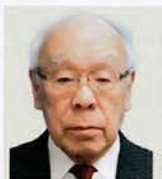
大仁 篠子 敬美 勇気・力・誠実・ 行動するライオンズに