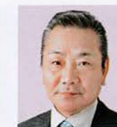
静岡弥生 松下 補 未来に繋げよう 心豊かな奉仕の輪