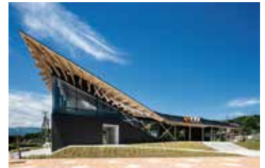
富士に向かって駆け上がる足柄駅舎 (JR御殿場線)